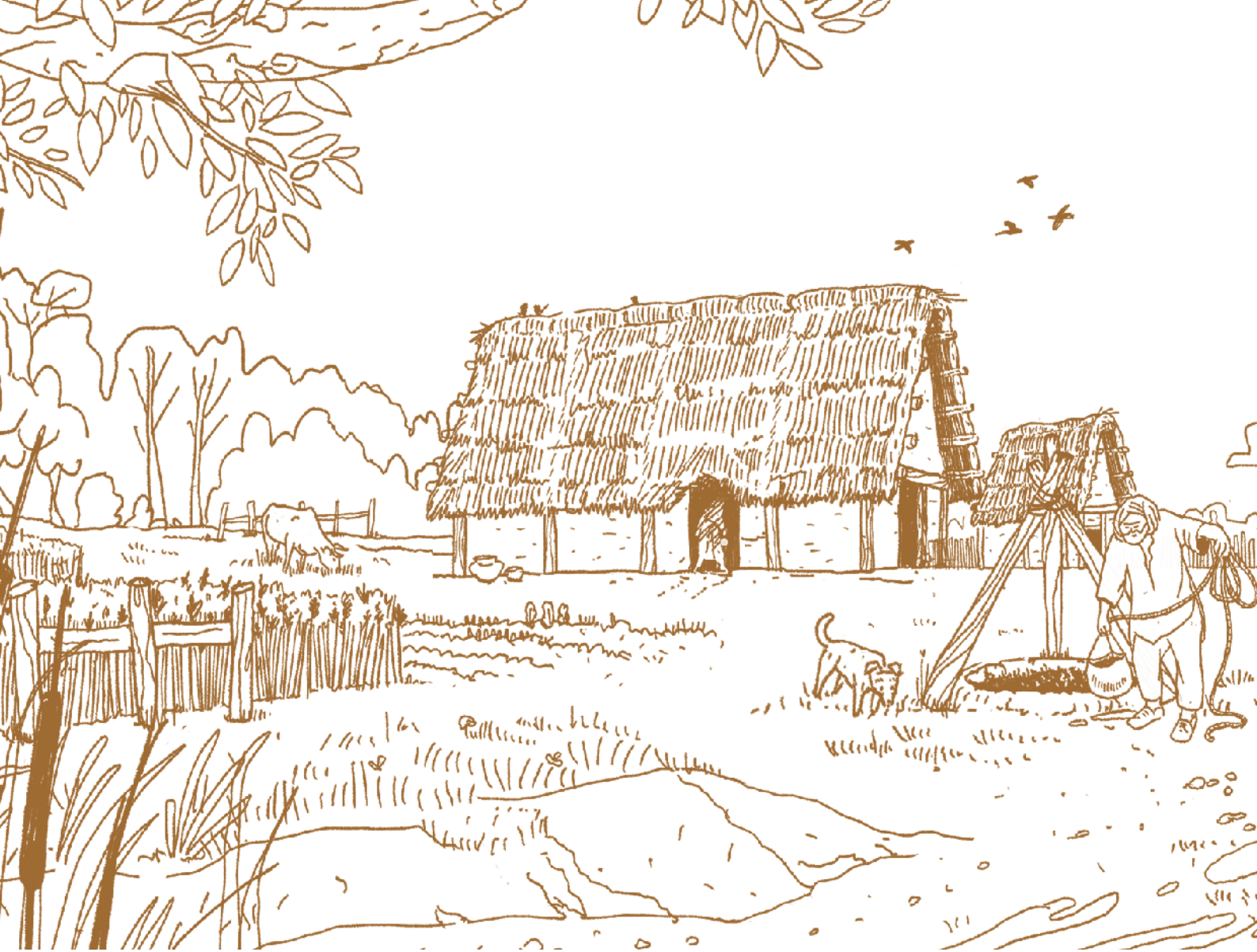
↑ Habitat type de l'âge du Bronze