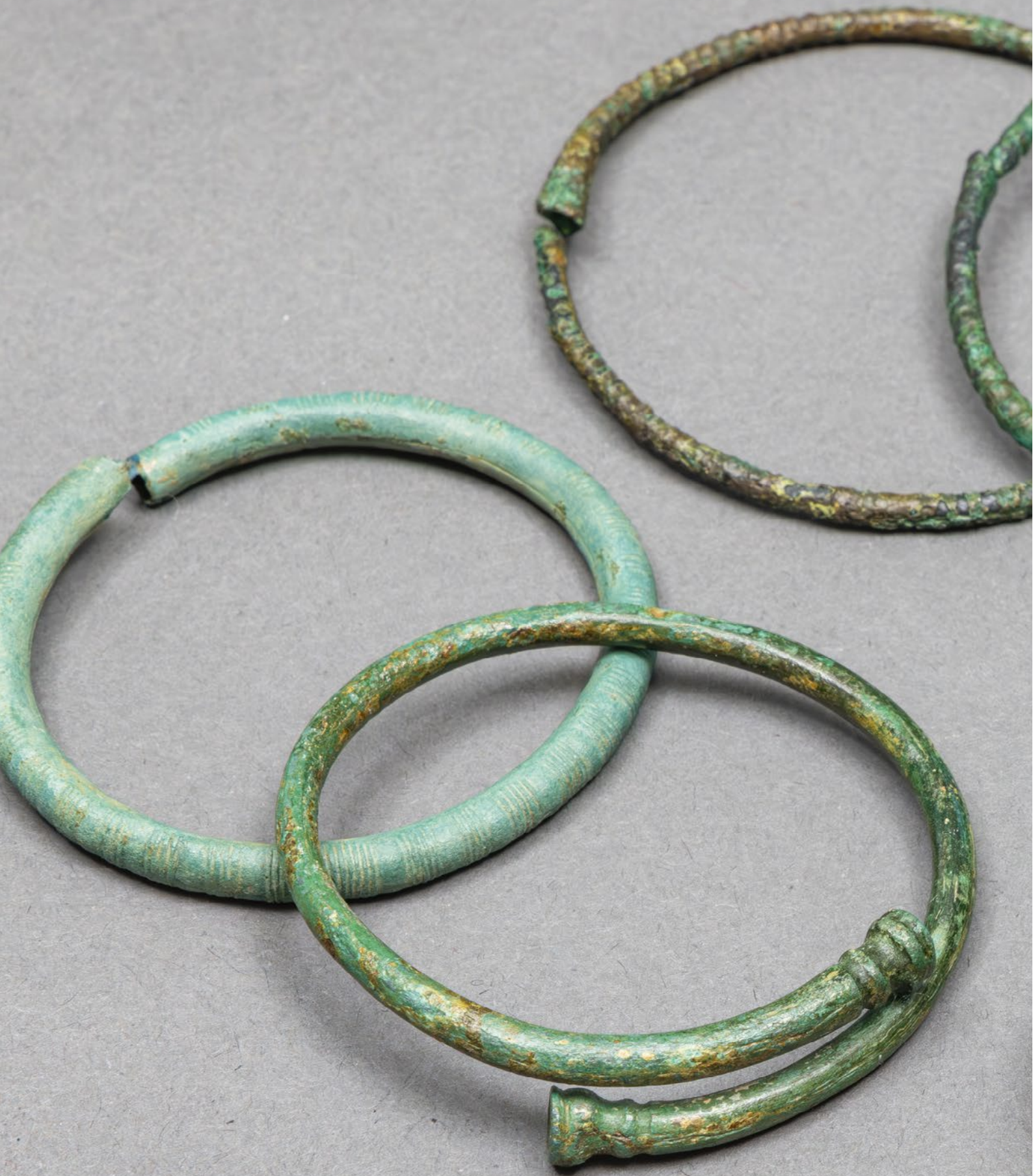
↑ Bracelets en bronze